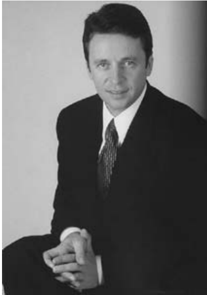
Finanzminister Ivan Miklos

Wenn die Sprache auf Wirtschafts- und Finanzreformen kommt, reagiert der deutsche Steuerzahler inzwischen nur mit Verdrossenheit. Das Vermittlungsergebnis vom Ende des letzten Jahres weckte noch Hoffnung auf weitere Reformen in Richtung einer stärkeren Abgabentlastung, eines einfacheren Steuersystem und eines wettbewerbsfähigeren Arbeitsmarkts. Inzwischen hat der Alltag des deutschen Konsensföderalismus jedoch auch den größten Optimisten eingeholt.